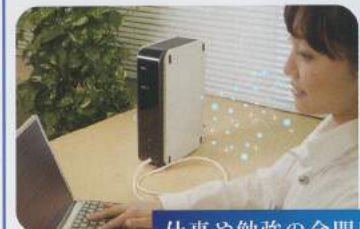
仕事や勉強の合間に

VIGO-PCT ※交換目安： 累積400時間経過または約1年 メーカー希望小売価格 16,200円(税込)