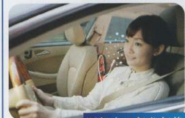
運転中の気分転換に