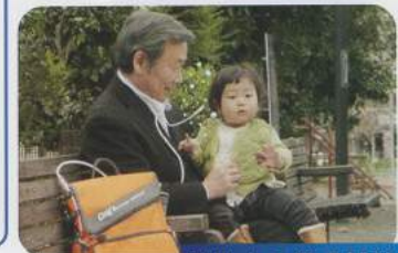
外出中の酸素補給に