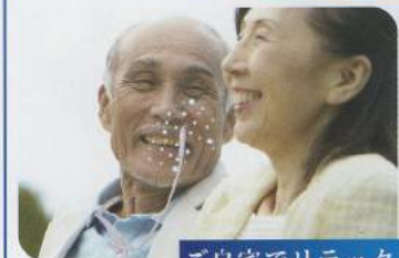
ご自宅でリラックス