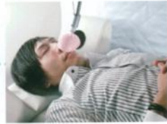
酸素濃縮器で高濃度酸素(最大50%)の直接吸引が可能です。 (注)オプション装置