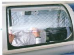
1人で出入りが楽な大型開口部