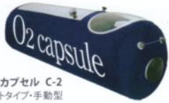
O2カプセル C-2 ソフトタイプ・手動型