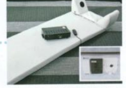
内蔵コンセントで小型TV・マッサージ機・オーディオ機器が使用可能です。 ボディソニック (注)オプション装置

※右記の方はご利用できません。■耳抜きができない方 ■糖尿病でインスリンを投与中の方 ■ペースメーカーを入れている方 ■妊娠中の方