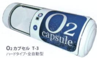
O2カプセル T-3 ハードタイプ・全自動型