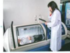
セラピー中でもインターフォンで安心な内外通話が可能です。