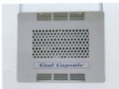
エアコン室内機。夏の汗ばむ季節も、快適な空間をつくれます。