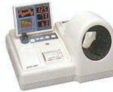
血圧・血流測定器