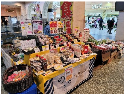
▲パラスポ農福連携マルシェ（イメージ）