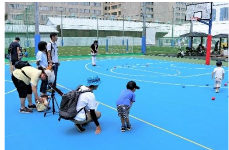
▲パラスポーツ（ボッチャ）体験ゾーン（イメージ）