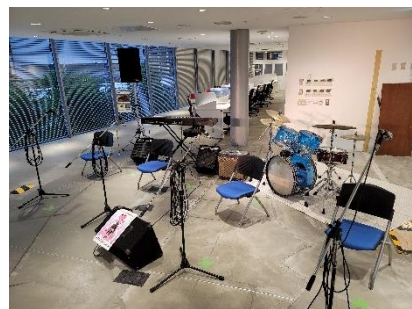
▲Music Station Tokyo