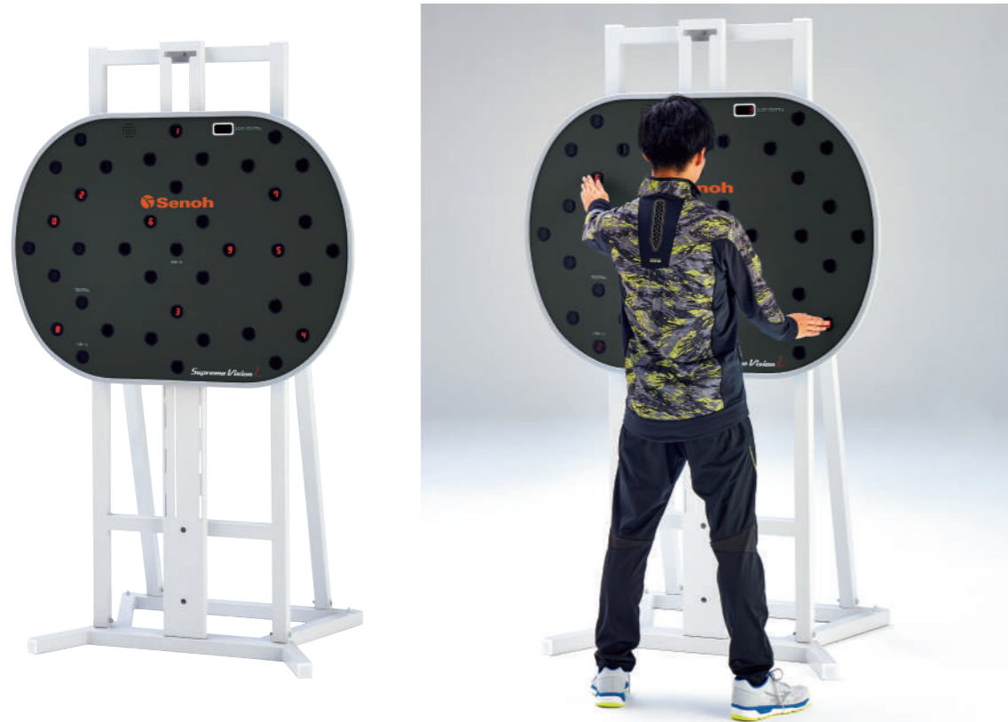
BZ9540 スープリュームビジョンL スタンドタイプ 本体価格：¥750,000+税(台)

人間の五感の中でもっとも情報を得られるために使用されている視覚をトレーニングすることで、より多くの情報を入手し判断する、様々なスポーツ能力の向上はもちろん、身体との協調動作による脳の活性化・先を読むイメージ力の向上などが期待できます。