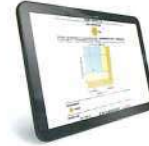
Wi-Fi iOS/Androidアプリ 測定の開始と結果の表示