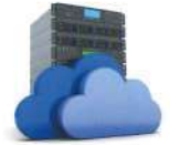
クラウドサーバ データの解析