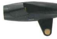
疲労ストレス計 MF100 バイタルデータの測定