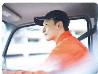
トラック・バス・タクシー ドライバーなどの 疲労・ストレス度チェック