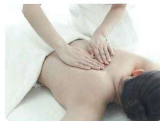
製薬・健康食品・リラクゼーション 関連企業での製品やサービスの 効果効果の把握