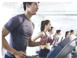
調剤薬局やスポーツクラブでの 健康支援活動