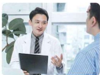
健康経営に取り組む 企業の社員健康モニタリング