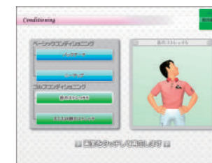
最適なコンディショニングメニューを提供